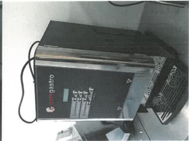
Meleg ital automata