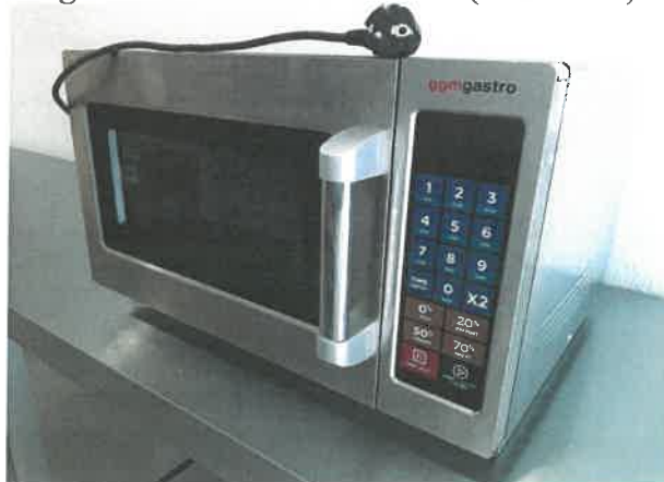
Ipari mikrohullámú sütő