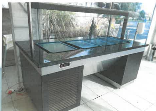
Saláta és hidegkészítmény hűtősziget